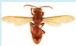
Frelon oriental signalé en Italie et à Marseille !