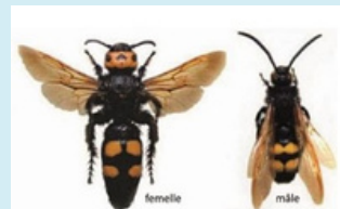
Scolie des jardins taille > 3.5 cm